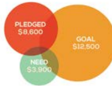
Lorem ipsum dolor sit amet unum consect etuer adipiscing elit sed diam nonummy nibh euismod tincidunt ut laoreet dolore.

Eodem modo typi qui nunc nobis videntur parum clari, fiant sollemnes in futurum lorem ipsum dolor sit amet, consectetur adipiscing elit erat euismod erat tincidunt ut laoreet dolore vel illum dolore eu feugiat.