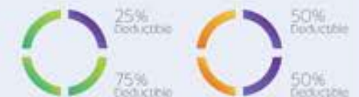
CHART OF ESTIMATED DATA FOR REFERENCE ONLY