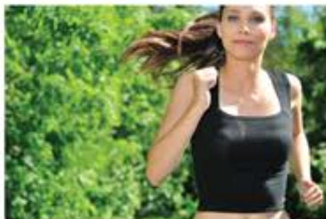
LOREM IPSUM DOLOR SIT AMET, CONSECTETUER AD.

Get fit tips to help maintain a clean, healthy lifestyle