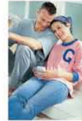
Lorem ipsum Dolore Sit Amet

Lorem ipsum dolor sit amet, consectetur adipiscing, sed diam nonummy nibh euismod tincidunt ut laoreet dolore magna aliquam erat volutpat. Lorem ipsum dolor sit amet, consectetur adipiscing, sed diam nonummy nibh euismod tincidunt ut laoreet dolore magna aliquam erat volutpat. Ut wisi enim ad erat minim veniam, quis nostrud exerci tation ullamcorper. Ut wisi enim ad erat minim veniam.